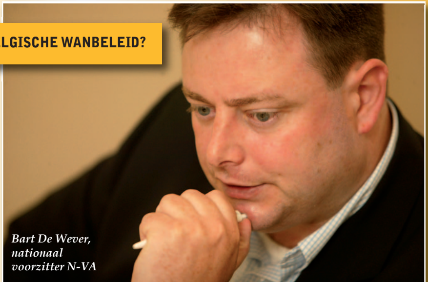
Bart De Wever, nationaal voorzitter N-VA

Want de socialisten dromen van hogere belastingen. Daarvan zullen vooral de Vlamingen de dupe zijn. En als het van Open Vld afhangt, moet Vlaanderen overschotten boeken zodat alle andere overheden de tekorten kunnen blijven opstapelen. Maar is het toeval dat de federale en de Brusselse regering, allebei met een Open Vld-minister van Begroting, de grootste tekorten hebben? Budgettaire discipline valt hen blijkbaar zwaar!