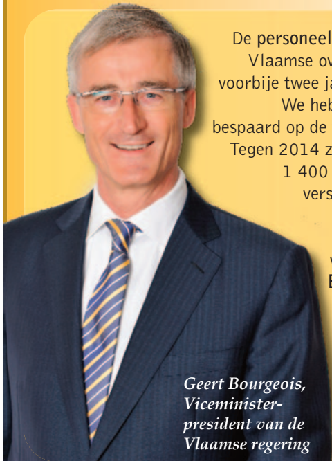
Geert Bourgeois, Viceminister- president van de Vlaamse regering

De personeelsbudgetten van de Vlaamse overheid daalden de voorbije twee jaar met 5 procent. We hebben ook drastisch bespaard op de werkingsmiddelen. Tegen 2014 zullen er bovendien 1 400 ambtenaren op de verschillende Vlaamse departementen niet stelselmatig vervangen worden. Een besparing van 50 miljoen euro per jaar!