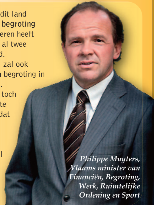
Philippe Muylers, Vlaams minister van Financiën, Begroting, Werk, Ruimtelijke Ordering en Sport

Als enige overheid in dit land heeft Vlaanderen een begroting in evenwicht. Vlaanderen heeft de voorbije twee jaar al twee miljard euro bespaard. De Vlaamse Regering zal ook de volgende jaren een begroting in evenwicht voorleggen. Als er geleidelijk aan toch wat budgettaire ruimte komt, investeren we dat zoals Europa vraagt: in onze economie (O&O, infrastructuur, werk ...) en in sociaal beleid (kinderopvang, wachtlijsten gehandicapten, kindpremie ...).