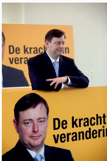
De kracht van verandering is meer dan Bart De Wever. N-VA Ham biedt oplossingen voor lokale problemen.

De laatste maanden waren het drukke tijden voor onze bestuursleden. Niet alleen hebben wij het N-VA-vormingstraject voor 2012 afgerond en werden er interne bestuursverkiezingen gehouden, we zijn ook reeds begonnen met de voorbereiding van de verkiezingen in oktober 2012.