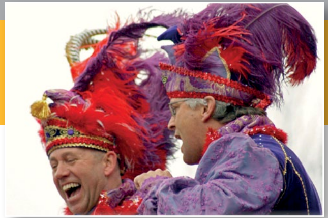
N-VA Ham pleit voor een doordachte ondersteuning van het Hamse Carnaval door het gemeentebestuur.

Het Hamse Carnaval verdient ondersteuning door het lokale beleid, zodat ook komende generaties ervan kunnen genieten. ▶