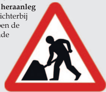
De wegenwerken aan de N141 zullen voor sommige bewoners ingrijpend zijn.

Ten slotte kunnen we melden dat de heraanleg van de N141 dichterbij komt. We hebben de op stapel staande onteigeningen gezien en deze zullen voor de ene al ingrijpender zijn dan voor de andere. Wij betreuren het nog steeds dat