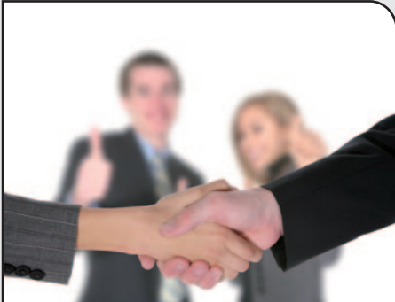
De meerderheid gooidde het op een akkoordje met Vlaams Belang voor een extra OCMW-raadslid.

De gemeenteraad van januari had enkele verrassingen in petto. Zo gooidde de meerderheid het op een akkoordje met Vlaams Belang om een OCMW-raadslid meer te krijgen dan waar men recht op had. Hierdoor heeft de N-VA een raadslid minder in het OCMW, maar kunnen we onze kiezers wel recht in de ogen blijven kijken. Voor de politieraad had CD&V een rekenfout gemaakt waardoor onze kandidaat wel verkozen is.