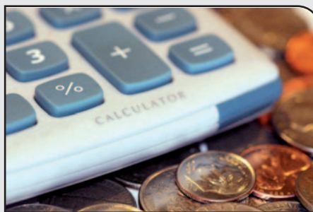
De dienstenbelasting ligt in Ham 30 euro hoger dan het bedrag dat met de Vlaamse overheid was afgesproken.

Onze meerderheid is trots dat ze het doet met vier in plaats van vijf schepenen maar de kostprijs van het college van burgemeester en schepenen stijgt niettemin tot 223 400 euro per jaar.