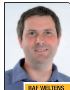
RAF WELTENS voorzitter PWA secretaris N-VA Ham

Een mailtje sturen naar pwa_ham@yahoo.com kan ook. Je kan hier ook terecht voor andere zaken als tuinklussen of opvang van kinderen bij u thuis.