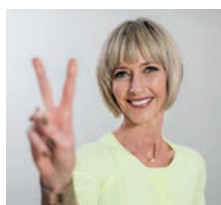
Grete Remen 3 de plaats Vlaams Parlement