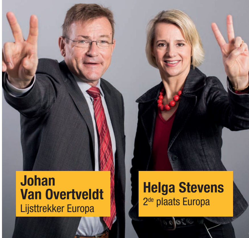
Johan Van Overtveldt

De N-VA wil dat de verschillende landen van de EU hun identiteit kunnen bewaren. De EU moet niet over alles beslissen. Een Verenigde Staten van Europa, een Europese superstaat, is dus géén goed idee. De Unie moet groeien van onderuit en mag niet van bovenaf worden opgelegd.