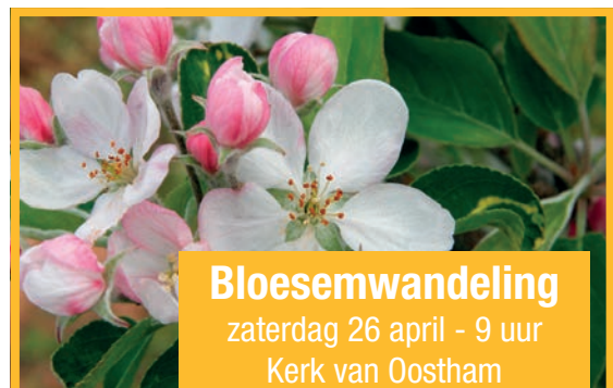
Bloesemwandeling zaterdag 26 april - 9 uur Kerk van Oostham