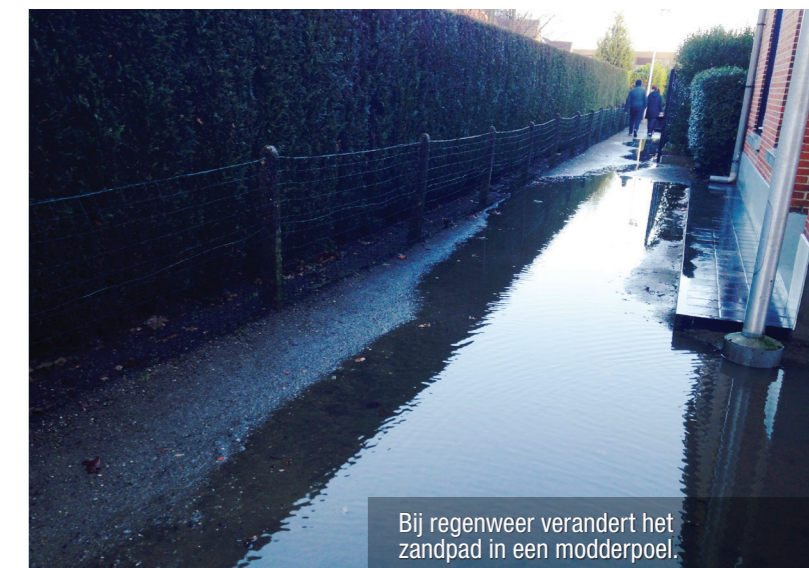
Bij regenweer verandert het zandpad in een modderpoel.

Tot op heden vinden we hiervan echter niets terug in de plannen. En dat terwijl de werken voor de deur staan.